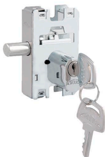
2171-INOX (1520-cilindro oval)