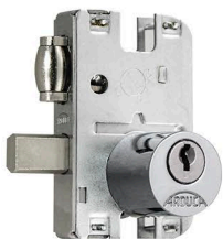
2171/69TR-INOX (1520-Trinco rolete)