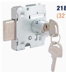
2189L-INOX (3210-cilindro redondo)