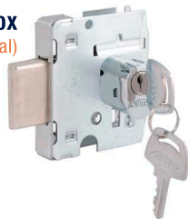
2192L-INOX (3210-cilindro oval)