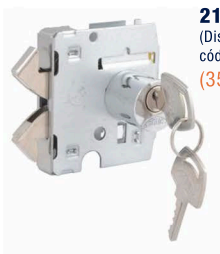
2189B-INOX (Disponível com 1/2 cilindro com o código 2189B/1-INOX - 3532 ) (3530-cilindro redondo)