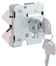
2192B-INOX (Disponível com 1/2 cilindro com o código 2192B/1-INOX - 3532 ) (3530-cilindro oval)