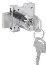
2193L/1-ZC (3210 Mini)