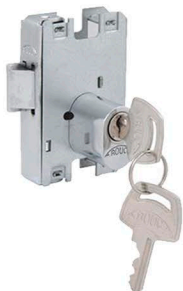
2371-INOX BATE-FECHA (1520 Bate-Fecha- Cilindro oval)