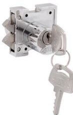
2193B-ZC (Disponível com 1/2 cilindro com o código 2193B/1-ZC - 3532 Mini ) (3530 Mini)