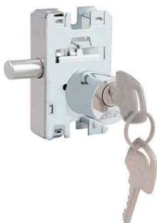
2171/69-INOX (1520-cilindro redondo)