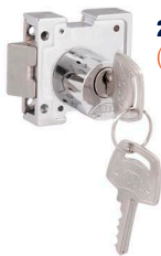
2393-ZC-BATE-FECHA (Mini bate-fecha)

• Disponível somente com cilindro redondo